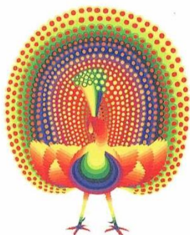
AY-O (暖嘔) あいお