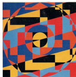
オノサト・シノブ